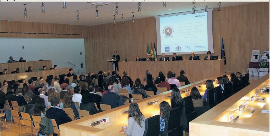
Apoio. Numerosos familiares y personale de cada uno de los centros participantes acudieron a la entrega de premios.